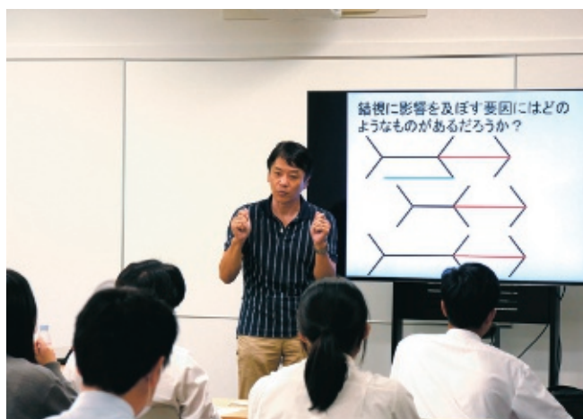
春日丘高校セレクト講座「心理学」(2024年10月21日実施)

京都府出身 関西学院大学文学部卒、心理学博士(関西学院大学) 日本学術振興会特別研究員、 京都大学霊長類研究所研究員、名古屋大学大学院 人間情報学研究科助手、 名古屋大学大学院情報科学研究科准教授を経て 2019年から現職