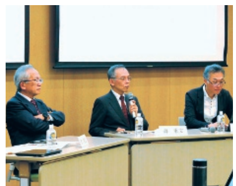
第3回創発鼎談会(ゲスト:平田豊教授)